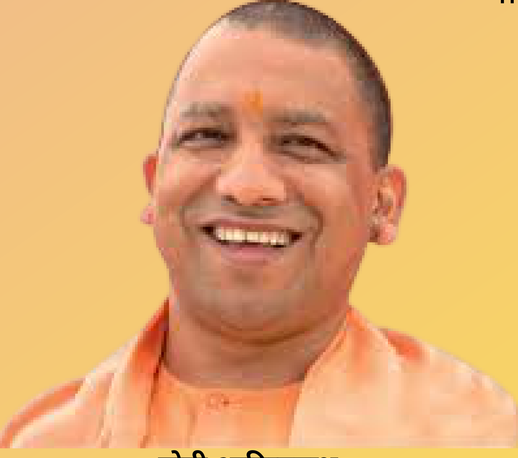
योगी आदित्यनाथ मा० मुख्यमंत्री, उत्तर प्रदेश

व्यावसायिक शिक्षा एवं कौशल विकास विभाग, उत्तर प्रदेश एवं सूक्ष्म, लघु और मध्यम उद्यम, उत्तर प्रदेश